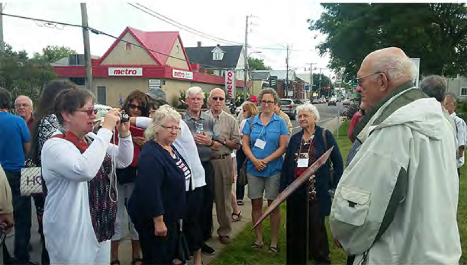
Le panneau d'interprétation est le 14e d'une série consacrée aux patriotes de Napierville. Sur la photo, quelques membres du groupe des Langlois d'Amérique qui ont assisté à l'inauguration.